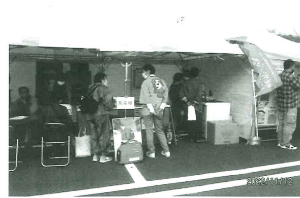
太田支部 常陸秋そばフェスティバルに出展

この補助事業は、【LPガス業界の発展に寄与すること】及び【支部活動の活性化を図ること】を目的としており、支部が独自に企画・立案した保安に関する講習会の開催や、市町村の産業祭への出展、市町村広報誌へのPR記事の掲載、自主防災訓練の実施、市町村主催の防災訓練への参加などに対して補助するものです。