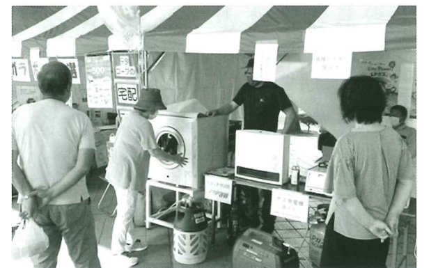
県南支部 土浦市産業祭に出展

なお、令和4年度において、日立支部では、高萩市・北茨城市の市報へLPガスのPR記事を掲載し、笠間支部でも、笠間市・桜川