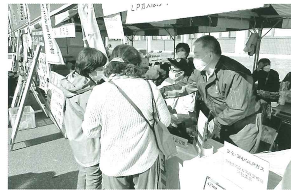
県西支部 常総ふるさと祭りに出展

この補助事業は、平成24年度から継続されており、補助額は1事業あたり原則10万円を上限(複数事業可)とし、特定の支部に偏らないようバランスを見ながら、申請に基づき予算の範囲内で決定しています。実施期間は、4月1日から2月末までとし、事業完了後に提出される実績報告書を精査した上で交付額を決定しています。今年度は、新型コロナウイルスの影響も多少はあるかと思われませんが、積極的な活用をお願いいたします。