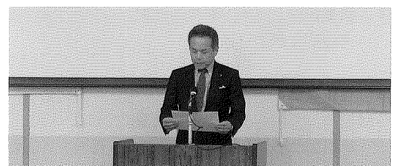
〈大会宣言及び決議〉