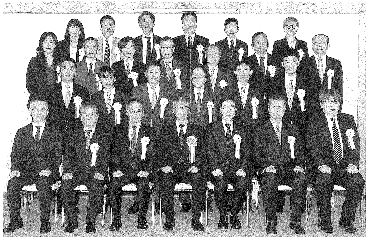
〈令和6年度愛媛県高圧ガス保安大会受賞記念〉