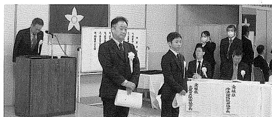
〈(一社)愛媛県LPガス協会会長表彰〉