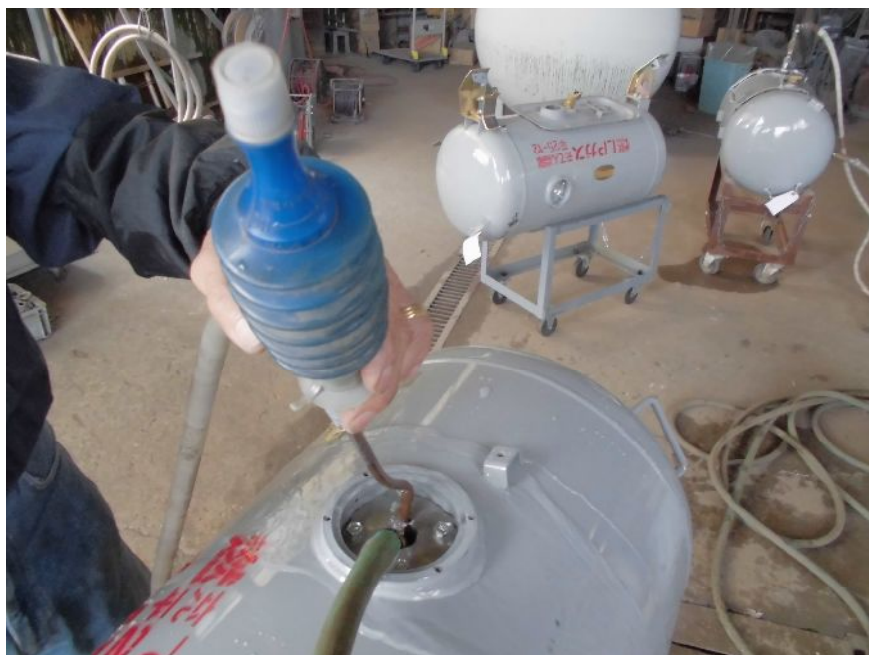
写真3 注水後のエア抜き作業

作業台に容器を載せ、ポンプ側を下向きにしてメインバルブ(左側)にガス回収ホースをつなぐ。