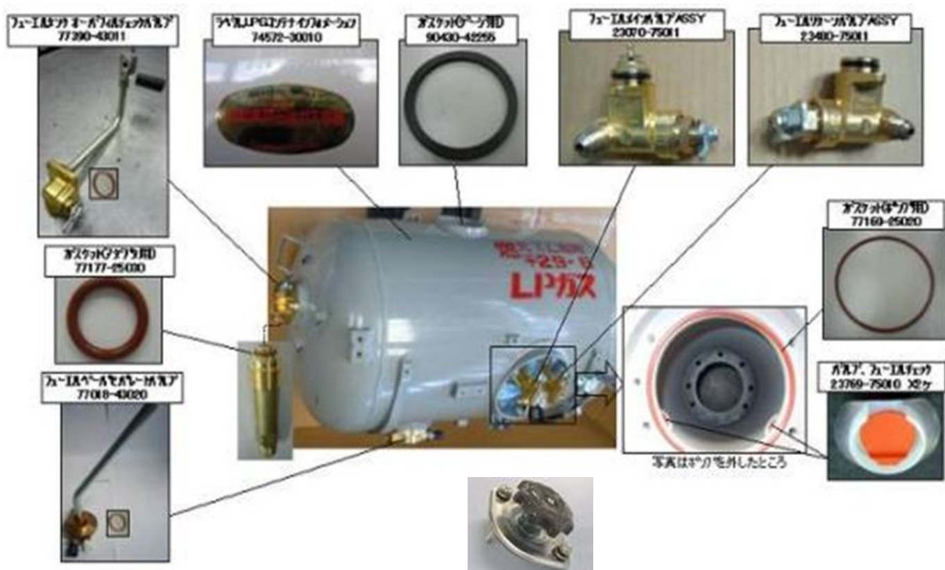
再検査キットに新型ハンドルASSYを追加

再検査を行う場合は、再検査キットを購入し、写真7の再検査キットに新型のハンドルASSYが追加されましたので、そのハンドルASSYを取り付けてください。