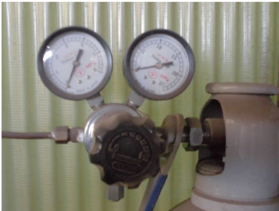
写真1 圧力調整器の例