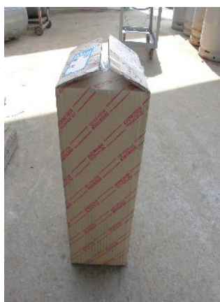
写真8 新ポンプ荷姿

なお、ポンプを交換される場合は、ポンプにメイン・リターンハンドルASSY (赤)が入ってます。