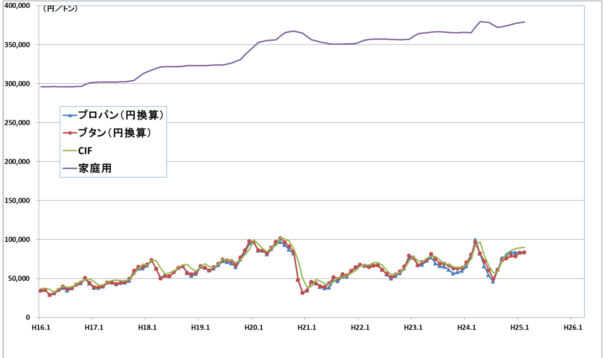
(参考)LP ガスの価格の推移